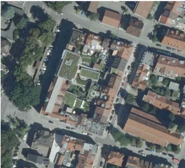
Abb. 1: Plangebiet; Lage im Raum

Innerhalb der Abgrenzung ist nur noch in Teilen historische Bausubstanz vorhanden. Besonders zu erwähnen ist hierbei das heutige Möbelhaus Maurer. Dieses Gebäude wurde um die Jahrhundertwende in ein Hotel umgebaut. Nach der Aufgabe der Hotelnutzung fand ein Möbelhaus eine Nutzung im Gebäude. Die restlichen Gebäude des abgegrenzten Bereichs sind jüngeren Datums und entsprechen daher dem modernen Architekturstil. Mit diesem heben Sie sich deutlich vom typischen Erscheinungsbild der Altstadtstrukturen ab.