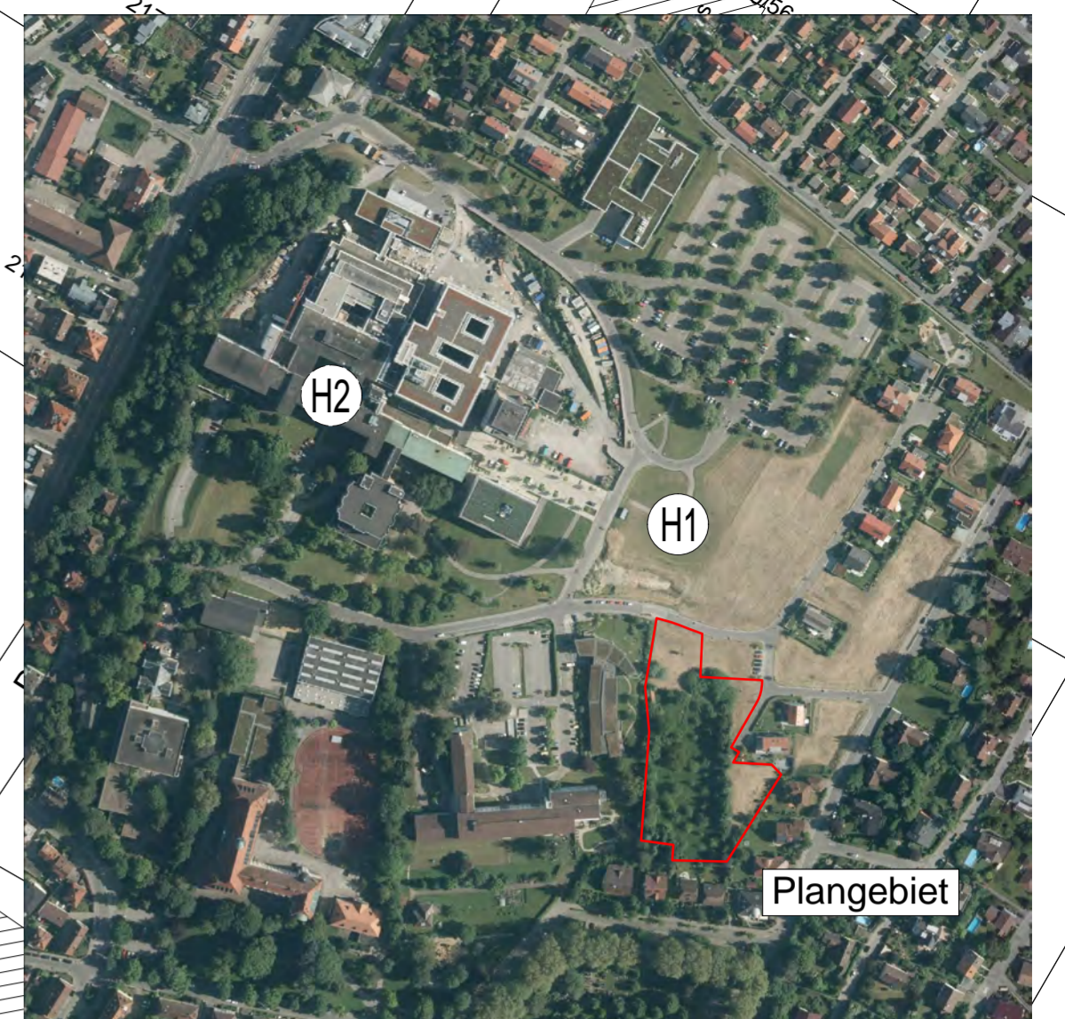
vorhandener Hubschrauberlandeplatz H1 (wird verlegt) geplanter Hubschrauberlandeplatz H2