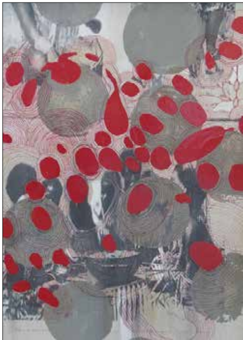
Thom Barth, Ohne Titel, 2003, Lack Acryl, Bleistift über Fotokopie, 41 x 27,5 cm (Ausschnitt), © VG Bild-Kunst, Bonn 2022