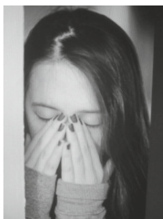
Lebenskrisen gehören zum Leben, was hilft damit zurecht zu kommen?

Vortrag am Mittwoch, 17. April, 19.00 Uhr im Magdalenensaal.