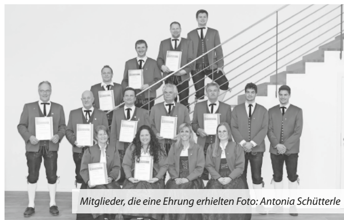
Mitglieder, die eine Ehrung erhielten