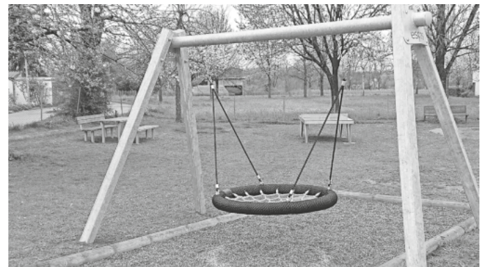
Neue Spielgeräte auf dem Spielplatz im Weiherstobelweg.

Wir wünschen den Großen und vor allem den kleinen Nutzern viel Spaß beim ausprobieren, spielen und toben auf dem Spielplatz Weiherstobelweg.