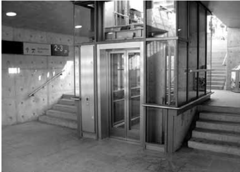
Die Gleise am Bahnhof Ravensburg sind mit dem Aufzug zu erreichen