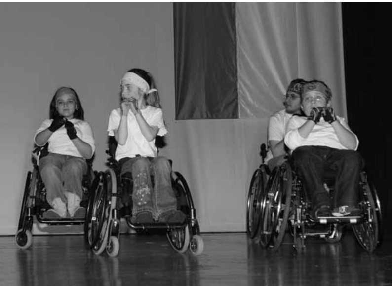
Rollstuhlsport für Kinder und Jugendliche