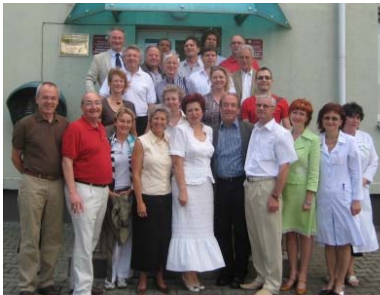
Unter der Leitung von Ravensburgs Oberbürgermeister Hermann Vogler (untere Reihe, 5. von rechts) besuchten Vertreter unterschiedlichster Bereiche aus dem Schussental die weißrussische Partnerstadt Brest.

Eine hochkarätige Delegation unter der Leitung von Oberbürgermeister Hermann Vogler besuchte jüngst die weißrussische Partnerstadt Brest. Ziel der Reise war es, die städtepartnerschaftlichen Beziehungen zu vertiefen, neue Projektpartnerschaften zu definieren sowie medizinische Einrichtungen, die vom Gemeindeverband Mittleres Schussental finanziell unterstützt werden, zu besuchen.