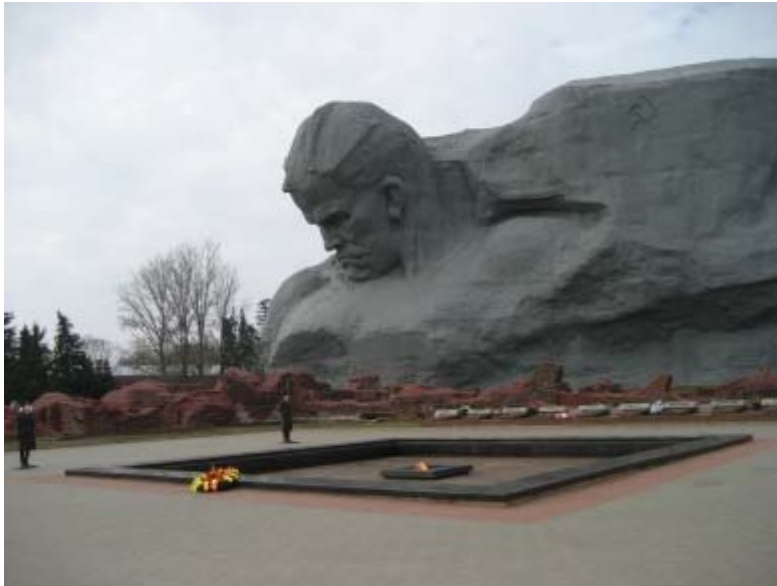
Brester Festung - hier starben beim Verteidigungskampf gegen die deutschen Angreifer im Jahr 1941 ein Großteil der Brester Verteidiger und ihre 300 Familien.

Trotz politischer Unterschiede, die im Laufe der Reise mehrfach thematisiert wurden, war für die Teilnehmer der Reise klar: Die Brester Gastfreundschaft ist eine ganz besondere, die Städtepartnerschaft ist ein wichtiger Prozess für die Demokratisierung des Landes.