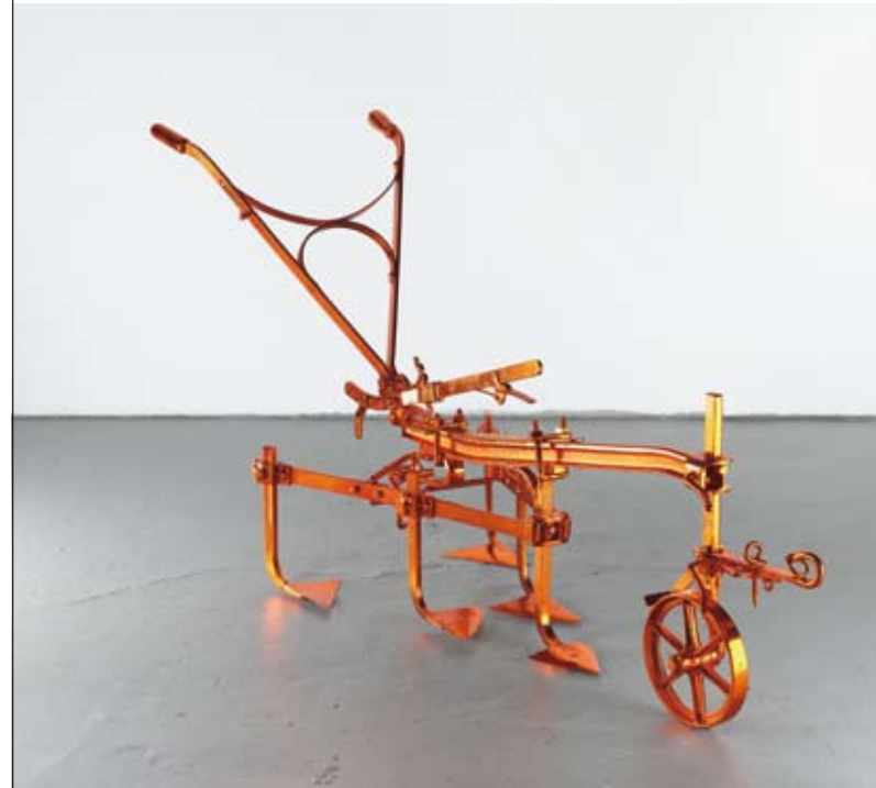
ANSELM REYLE Pflug 2007