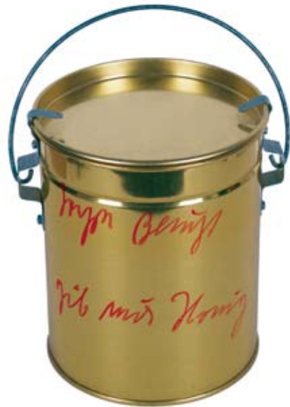
JOSEPH BEUYS Gib mir Honig 1979 Galerie Konzett, Wien