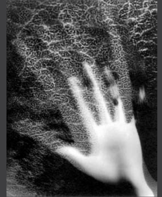
UNDINE 1977 Print der Schadographie

„Das Magische lässt das Geheimnisvolle bis ganz dicht unter die Haut der Dinge aufsteigen und durch sie hindurch scheinen – ohne die fragwürdig gewordene Oberfläche zu zerreißen.“ CHRISTIAN SCHAD