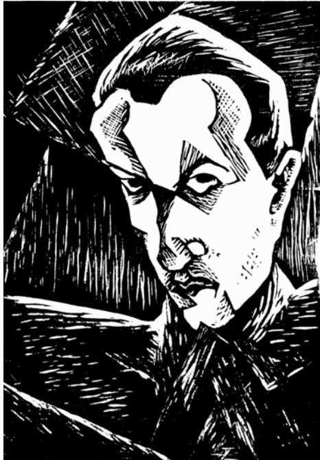
SELBSTBILDNIS 1915 Holzschnitt

„Die Graphik ist, da schwarz-weiß, am primitivsten und der Wahrheit am nächsten.“ CHRISTIAN SCHAD