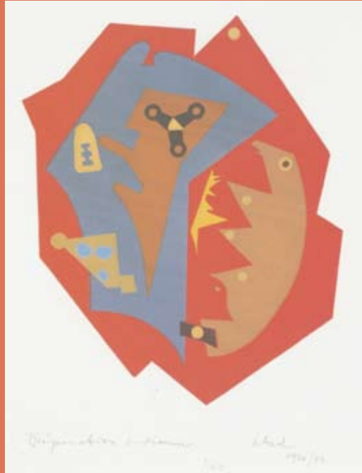
TRÉPANATION INDIENNE 1920 Linarschnitt

„Dada war keine Richtung, vielmehr die Idee der unbändigen Freiheit – alles machen zu dürfen, alles machen zu können, ohne das Damoklesschwert der schwerfälligen und zähen Dogmen einer Tradition über sich zu fühlen.“ CHRISTIAN SCHAD