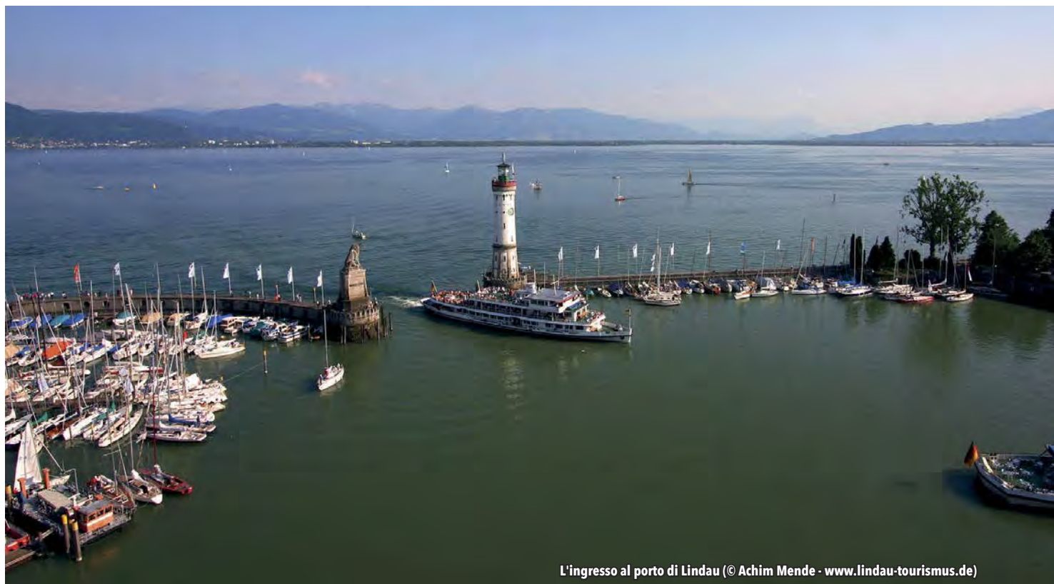
L'ingresso al porto di Lindau