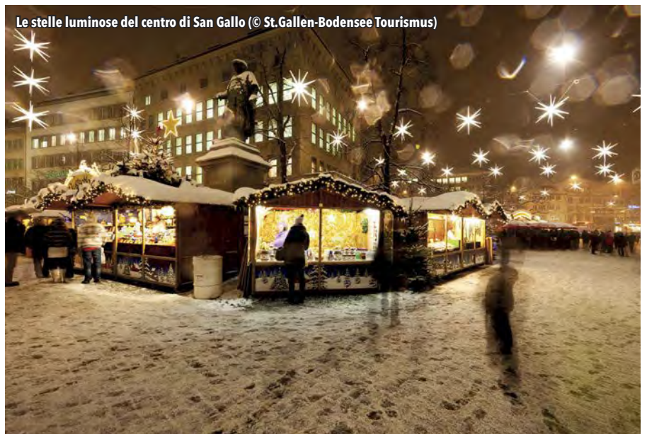
Le stelle luminose del centro di San Gallo