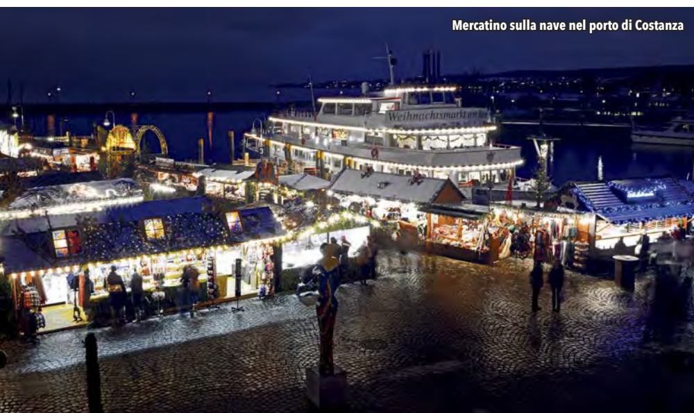
Mercatino sulla nave nel porto di Costanza