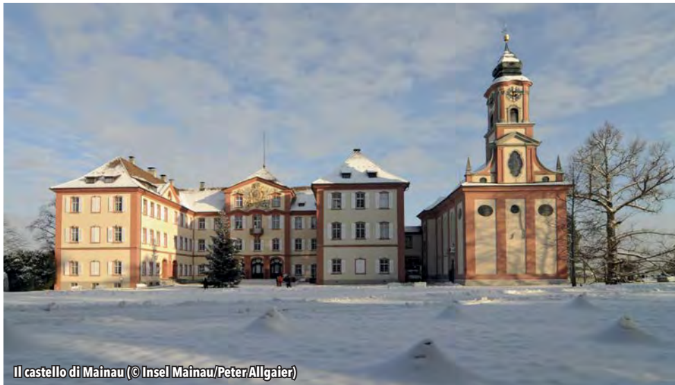
Il castello di Mainau

ricorrente è sempre lo stesso, ogni sede di mercato offre qualcosa di particolare che lo diversifica dagli altri.