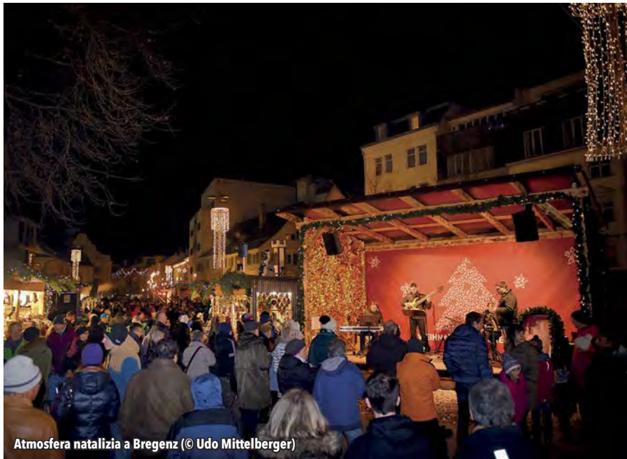
Atmosfera natalizia a Bregenz

si trova un grande albero di Natale addobbato da più di 20mila luci , donato ogni anno da un comune situato nella foresta di Bregenz. Infine nel Leutbühel viene allestito un presepe vivente. La parte alta è invece dedicata alla tradizioni artigianali: presepi e oggetti intagliati nel legno, decorazioni e luci, pellame, giacche, guanti, mantelle, sciarpe e berretti sono l'offerta che gli artigiani rivolgono ai visitatori. Naturalmente la visita delle bancarelle viene accompagnata dalla tradizionale musica natalizia e riscaldata dalle diverse offerte di bevande calde. In aggiunta si potrà pattinare sul ghiaccio e cavalcare sui pony. I mercatini avranno luogo dal 22 novembre al 23 dicembre, dalle 14.00 alle 21.00 (lunedì-giovedì) e dalle 11.00 alle 21.00 (venerdì-domenica).