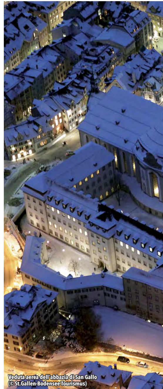
Veduta aerea dell'abbazia di San Gallo

bel centro storico, certamente degno di una visita, anche se il suo pezzo forte è costituito dall' abbazia barocca con un'impressionante cattedrale e una ancor più impressionante biblioteca. Molte sono le attività che prendono vita durante il periodo dell'Avvento. Si comincia con il gigantesco albero di Natale posto proprio di fronte alle sfarzose torri barocche della cattedrale e si prosegue con 700 stelle luminose che regalano alle strade e alle piazze un'atmosfera magica. Ogni stella è opportunamente disposta in modo da formare motivi diversi: all'incrocio tra la Marktgasse e la Marktplatz danno vita a un fitto tetto di luce;