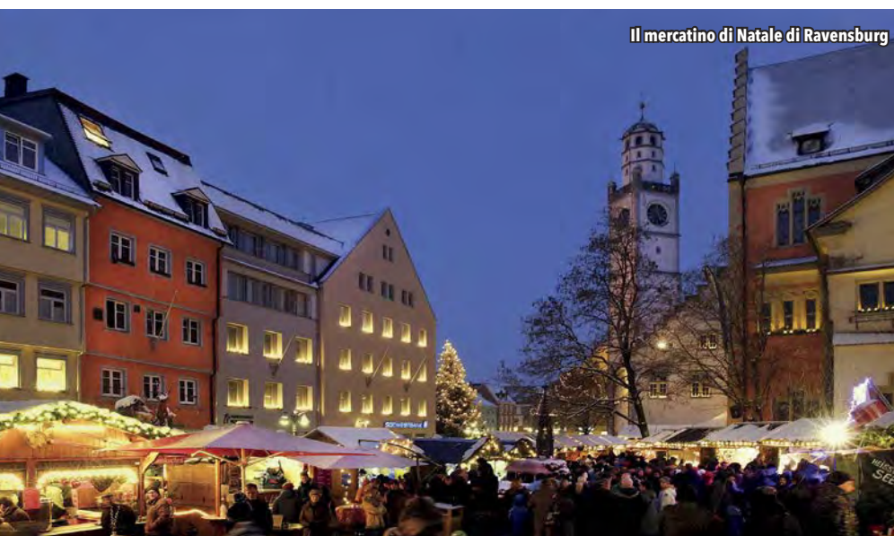
Il mercatino di Natale di Ravensburg

terraferma tramite un ponte stradale proprio dove si incontrano i confini della Germania, dell'Austria e della Svizzera. È al porto , considerato il più attraente di tutto il lago, che si svolge il mercatino natalizio a cui fanno da scenario il faro e il leone di Baviera. In una magica atmosfera, le colorate bancarelle offrono al pubblico oggetti artistici, prodotti dell'artigianato e tutto ciò che l'accezione comune identifica con il Natale. Quando poi, tra una bancarella e l'altra, si vorrà effettuare una pausa, si potranno gustare una buona tazza di tè o altre bevande calde, tra cui il classico vin brulé (a cui i