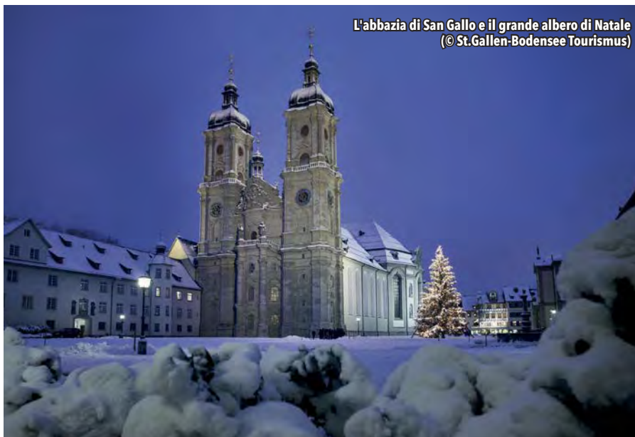
L'abbazia di San Gallo e il grande albero di Natale

nelle stradine e nei vicoli a sinistra e a destra dell'incrocio assumono la forma di gocce di pioggia; tra le porte Müller e Spise cambiano continuamente l'intensità della luce. Ed è proprio in mezzo a questa sinfonia di colori e ai concerti di musiche della tradizione che si trovano le bancarelle del mercato, sapientemente dislocate lungo le viuzze e le piazzette del centro storico. L'offerta di prodotti è molto ricca e si va dalle specialità gastronomiche, come i bratwurst ►