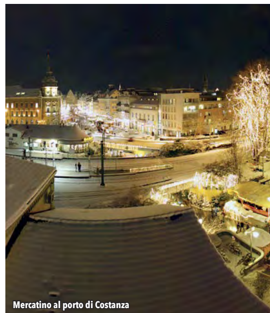
Mercatino al porto di Costanza

Proseguiamo il nostro vagabondare spostandoci a Costanza , dove visiteremo il mercatino natalizio più grande del Bodensee. La città, fondata dai romani con il nome di Drusomagus, possiede un centro storico in cui fa bella mostra di sé il duomo. La parte più interessante della città vecchia è il Niedenburg, formato da case e stradine veramente pittoresche. Ed è tra le viuzze del centro storico e il porto che si svolge il mercatino natalizio che ogni anno richiama circa mezzo milione di visitatori. Le oltre 170 bancarelle presentano i loro prodotti, costituiti da regali originali, specialità gastronomiche e bevande calde. Benchè il mercato sia ricco di merci, è l'atmosfera che si viene a creare a rappresentare la vera attratti-