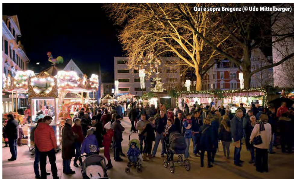
Qui e sopra Bregenz