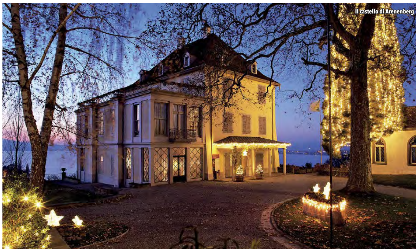
Il castello di Arenenberg